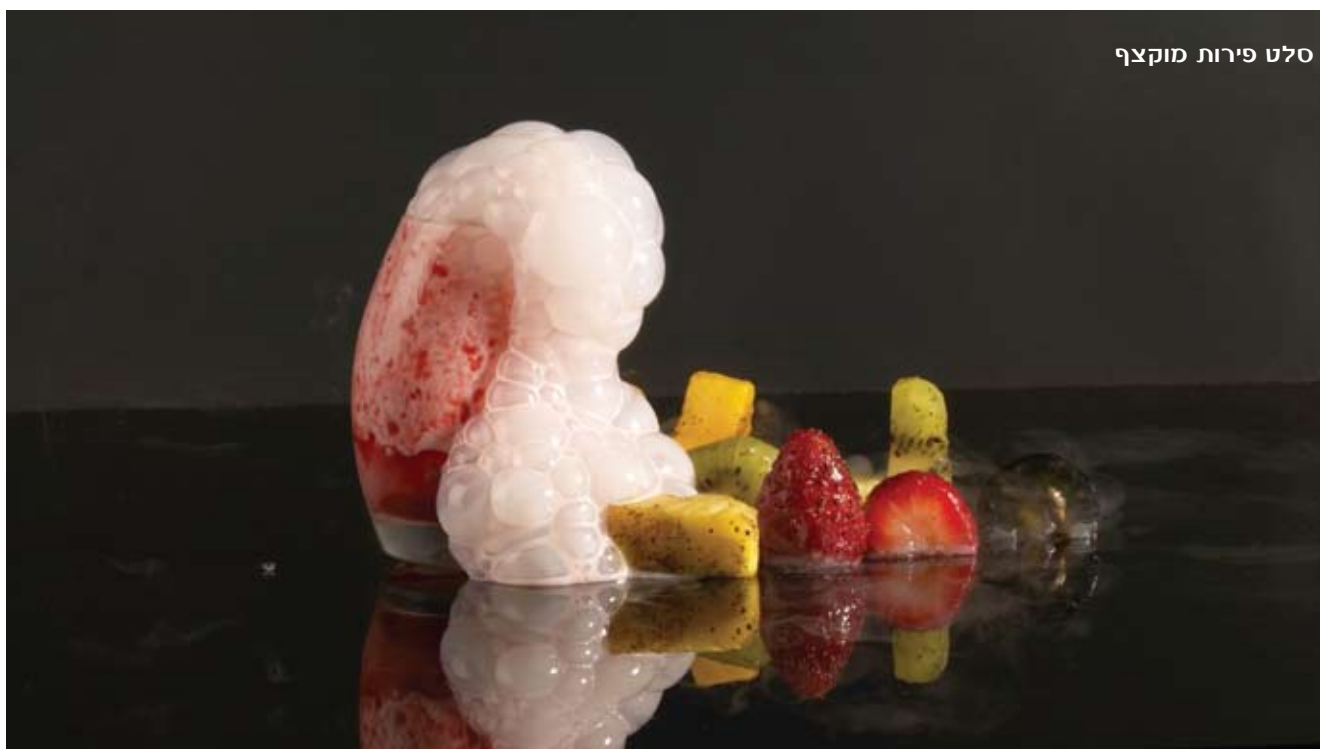
סלט פירות מוקצף